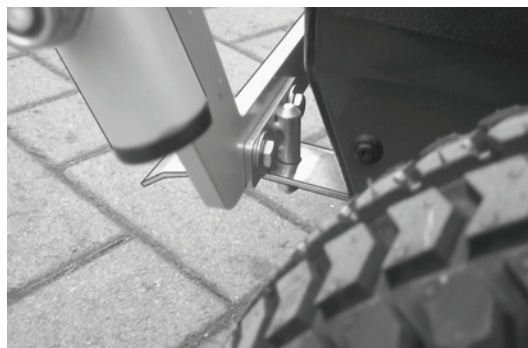
Нижний край руля, правая сторона

Стержень уже прикручен болтом и повернут так, чтобы избежать прокола картонной коробки. Поверните стержень в нужное положение (как изображено на рисунке) и прикрутите его с помощью второго болта. Благодаря продольным пазам возможна боковая регулировка, чтобы стержень точно входил в отверстия листовой пружины при установке руля в рабочее положение.